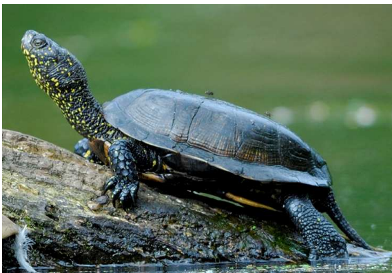
Cistude d'Europe

Cette espèce endémique d'Europe est menacée de disparition, et strictement protégée ! Sa présence est avérée sur l'Engranne... Nous cherchons à mieux connaître les individus qui habitent ici, pour pouvoir mieux les protéger.