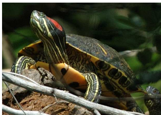
Tortue à tempes rouges (ou tortue de Floride)

Cette espèce introduite, originaire d'Amérique, peut représenter une menace pour la survie d'autres espèces protégées. Nous cherchons à savoir combien d'individus sont présents et s'ils représentent ou non une menace pour la conservation de la Cistude.