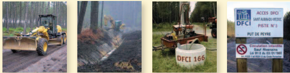
Pistes et ponts Fossés Points d'alimentation en eau Panneaux

Depuis 1945, elles aménagent la forêt en pistes, fossés, points d'alimentation en eau, ponts :